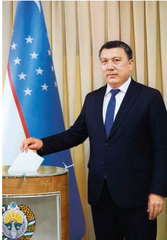
Кандидат в Президенты Республики Узбекистан от Экологической партии Узбекистана Нарзулло Обломуродов проголосовал на избирательном участке № 579 города Ташкента.

24 октября кандидат от Экологической партии Узбекистана Нарзулло Обломуродов, кандидат от Народно-демократической партии Узбекистана Максуда Варисова, кандидат от Движения предпринимателей и деловых людей - Либерально-демократической партии Узбекистана Шавкат Мирзиёев, кандидат от Демократической партии Узбекистана «Миллий тикланиш» Алишер Кодиров, кандидат от Социал-демократической партии Узбекистана «Адолат» Бахром Абдухалимов проголосовали на выборах Президента