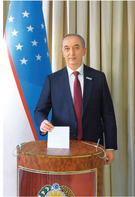
Кандидат в Президенты Республики Узбекистан от Социал-демократической партии Узбекистана «Адолат» Бахром Абдухалимов проголосовал на избирательном участке № 405 города Ташкента.

Нынешние выборы прошли в соответствии с международными стандартами на основе принципов гласности, многопартийности, свободы и равенства. В избирательном законодательстве закреплены свободное участие граждан в избирательной кампании, непосредственное использование своего права при тайном голосовании.