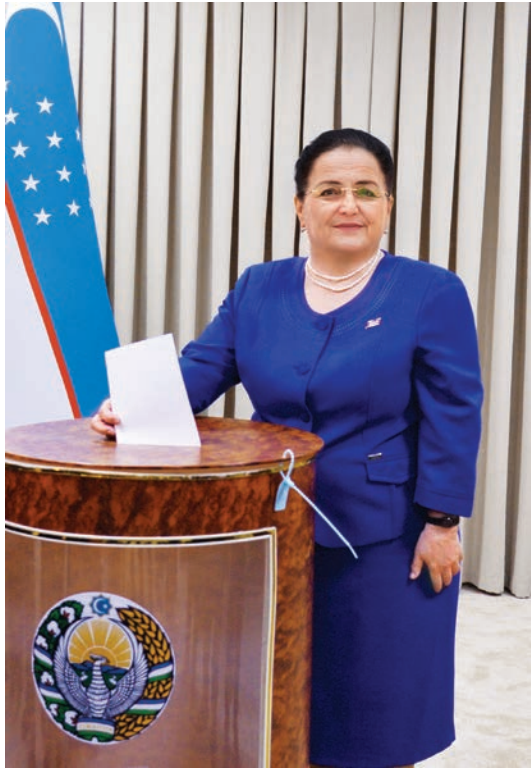
Кандидат в Президенты Республики Узбекистан от Народно-демократической партии Узбекистана Максуда Варисова проголосовала на избирательном участке № 206 Учтепинского района столицы.

Главная цель предвыборной программы партии под девизом «Мы в ответе за будущее» - обеспечение экологической стабильности в стране, рациональное использование природных ресурсов, создание достойных условий жизни для нашего народа и будущих поколений, построение благополучного общества за счет широкого внедрения принципов «зеленого» развития во всех отраслях экономики.