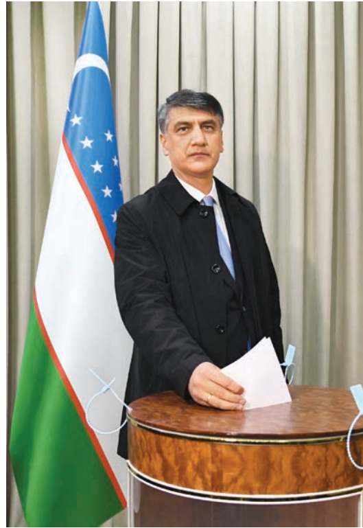
Кандидат в Президенты Республики Узбекистан от Демократической партии Узбекистана «Миллий тикланиш» Алишер Кодиров проголосовал на избирательном участке № 116 города Ташкента.

Президентские выборы - важное для будущего страны политическое событие. Граждане глубоко осознавали это и активно участвовали в выборах.