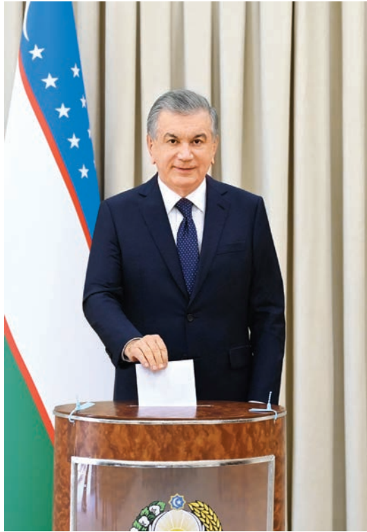
Президент Республики Узбекистан, кандидат в Президенты от Движения предпринимателей и деловых людей - Либерально-демократической партии Узбекистана Шавкат Мирзиёев вместе с членами семьи прибыл на избирательный участок № 59 Мирзо-Улугбекского района города Ташкента и проголосовал на выборах.

Наши соотечественники приняли активное участие в выборах Президента Республики Узбекистан. Это доказывает, что они глубоко чувствуют ответственность за судьбу Родины и будущее наших детей.