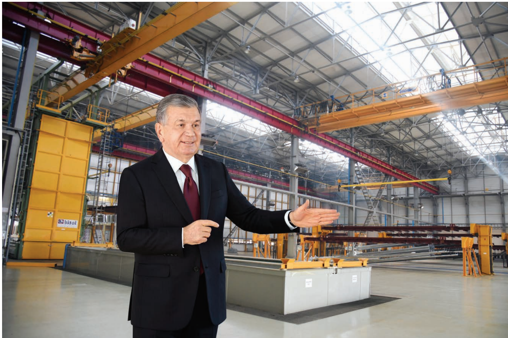
Президент Республики Узбекистан Шавкат Мирзиёев 21 августа ознакомился с работой, проводимой в Бектемирском районе города Ташкента, и деятельностью промышленных предприятий.

Предприятия, приостановившие работу из-за пандемии, постепенно восстанавливают свою деятельность. Для выхода на полную мощность им необходимы время и поддержка. В ряде Указов Президента Шавката Мирзиёева и на видеоселекторных совещаниях под его председательством были определены и в настоящее время последовательно реализуются конкретные задачи в этом направлении.