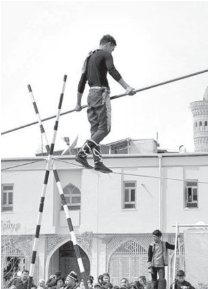
каждые два года смотра-конкурса «Династии палванов» с участием палванов и дорбозов.

Узбекская школа дорбозов имеет свои особенности. Наши канатоходцы выполняют захватывающие дух упражнения на высоте не менее 12 метров. Соответственно, велика роль шеста в балансировке. А также это требует от дорбоза знаний и навыков, внимательности, бдительности, умения быстро выходить из затруднительного положения. Известно, что ребенок начинает испытывать страх, когда достигнет