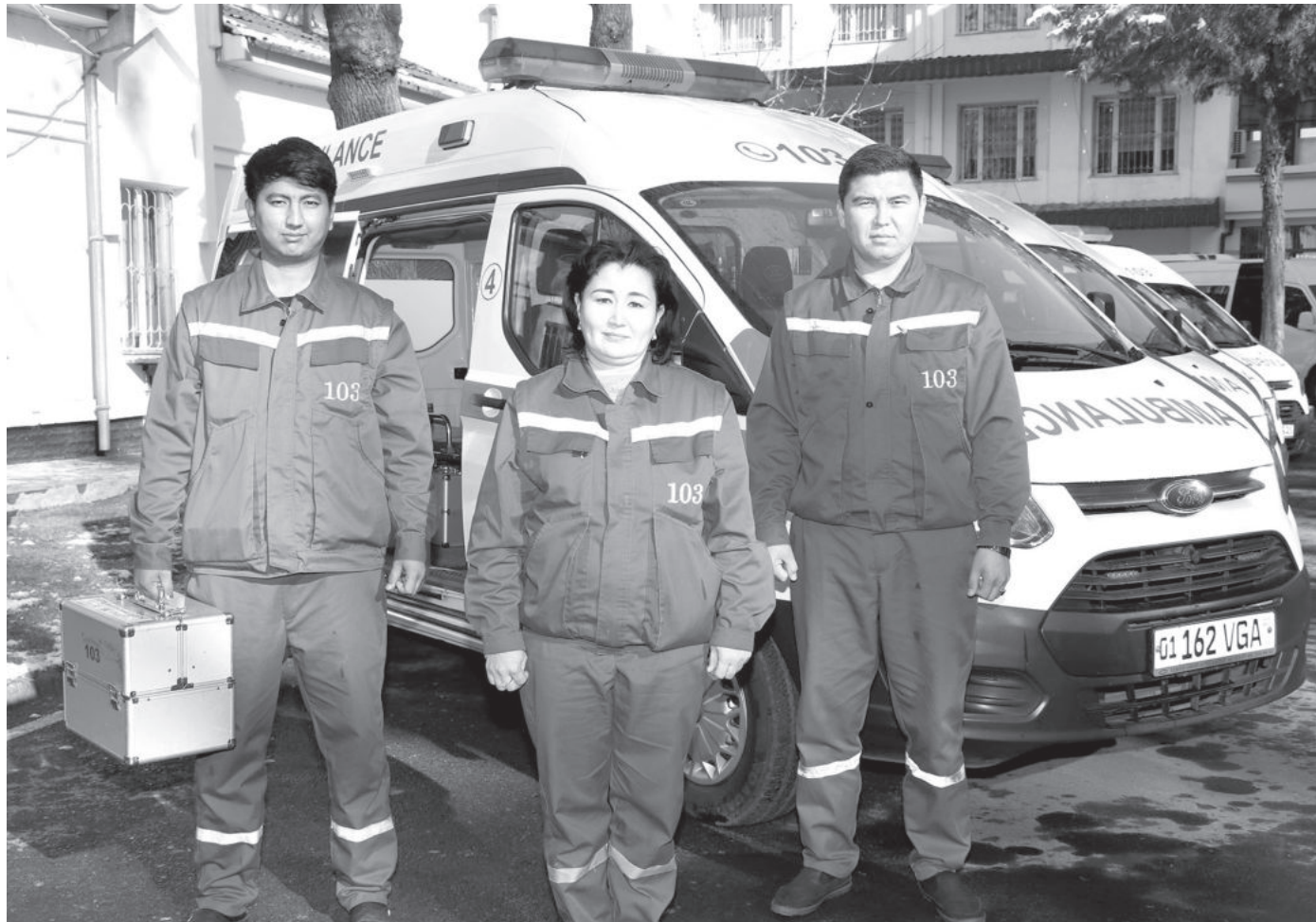
(Окончание. Начало на 1-й стр.)

В Узбекистане действует единая служба экстренной медицинской помощи (СЭМП), которая отвечает самым высоким требованиям и состоит из центра, областных филиалов и отделений экстренной медицинской помощи в регионах и районах.