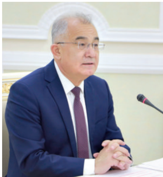
Акмал САИДОВ, Инсон ҳуқуқлари бўйича Ўзбекистон Республикаси Миллий маркази директори

6 2021 ЙИЛ 8 ОКТЯБРЬ КУНИ ЖЕНЕВА ШАҲРИДА БМТ ИНСОН ҲУҚУҚЛАРИ БЎЙИЧА КЕНГАШИНING 48-СЕССИЯСИ ДОИРАСИДА ЎЗБЕКИСТОН ТАШАББУСИ АСОСИДА ЁШЛАРНИING ИНСОН ҲУҚУҚЛАРИГА COVID-19 ПАНДЕМИЯСИ ТАЪСИРИНИING ОҚИБАТЛАРИ ТЎҒРИСИДАГИ РЕЗОЛЮЦИЯ ҚАБУЛ ҚИЛИНДИ. РЕЗОЛЮЦИЯНИ ИШЛАБ ЧИҚИШ ВА ҚАБУЛ ҚИЛИШ ТАШАББУСИНИ ЎЗБЕКИСТОН ПРЕЗИДЕНТИ 2021 ЙИЛ 22 ФЕВРАЛЬ КУНИ БМТ ИНСОН ҲУҚУҚЛАРИ БЎЙИЧА КЕНГАШИНING 46-СЕССИЯСИДА ИЛГАРИ СУРГАН.