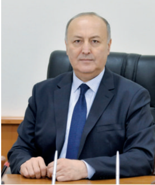
Адҳам БЕКМУРОДОВ, Ўзбекистон Республикаси Президентини ҳузурдаги Давлат бошқаруви академияси ректори

мақсади адолатли давлат барпо этиш, халқимизга фаровон ҳаёт, инсон эркинлиги, хавфсизлиги, қадри учун муносиб шароит яратишдан иборатдир.