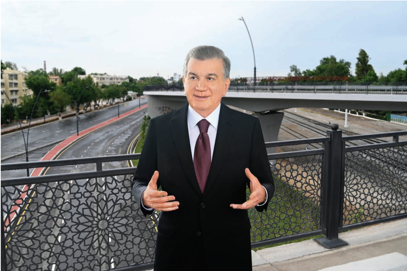
Президент Шавкат Мирзиёев 3 мая ознакомился с новыми объектами транспортной инфраструктуры и Ситуационно-аналитическим центром Министерства внутренних дел в городе Ташкенте.

В священном месяце Рамазан было много новшеств. В дни Хайита в Ташкенте сданы в эксплуатацию новые дорога и развязка.