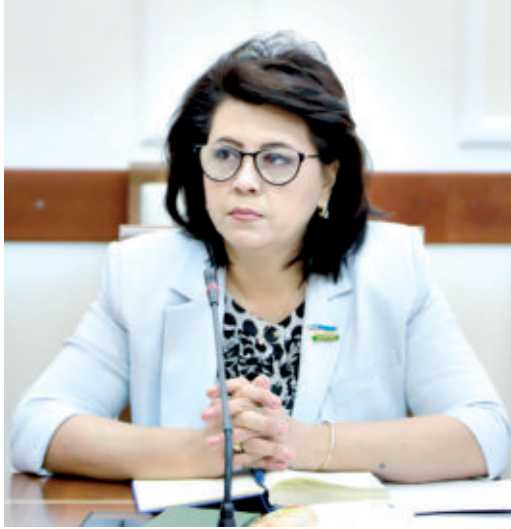
Гулнору АЪЗАМОВА, Олий Мажлис Қонунчилик палатаси депутаты