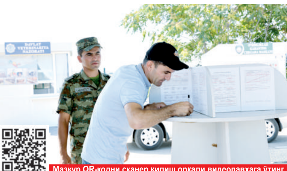
Мазкур QR-кодни сканер қилиш орқали видеолавҳага ўтинг.

Дарвоқе, ҳамжихатликда, ўзаро ишонч ва аҳилчиликда гап кўп. Ҳали яхши қўшничилик муносабатларининг ташаббускори ва архитектори сифатида Президентимиз Шавкат Мирзиёев илгари сурган ташаббуслар эпкинни халқларимиз ҳаётига қатор энгилликлар, янгиланишлар на-фасини олиб киради.