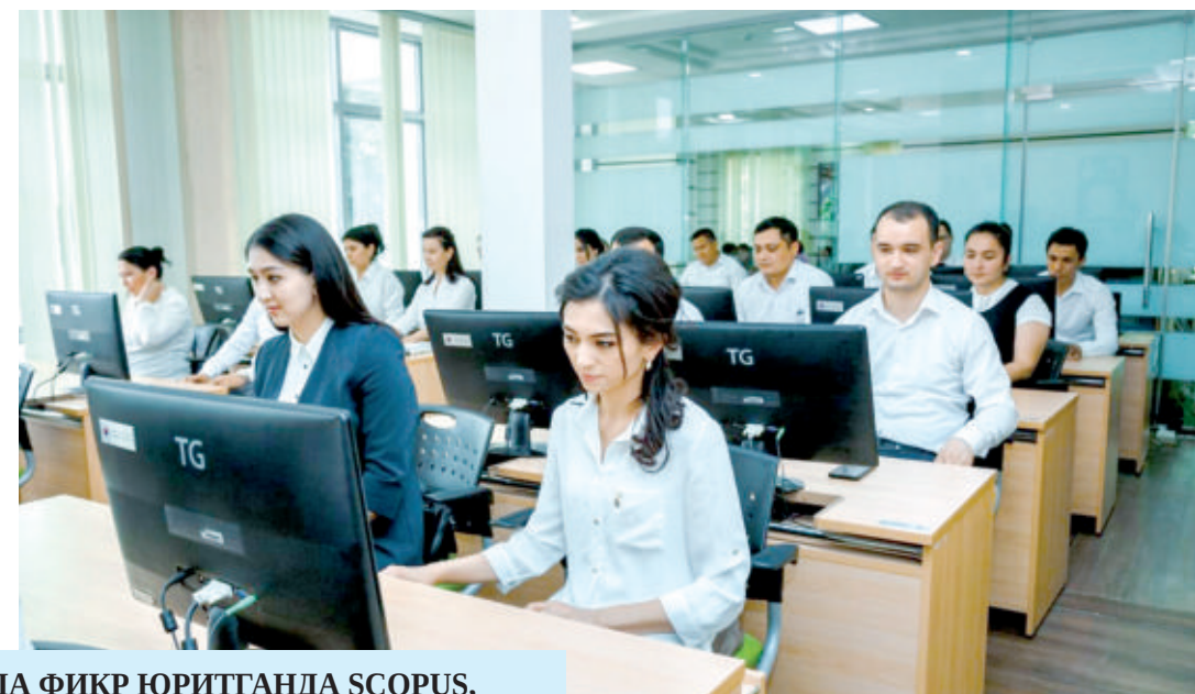
Фаоллигини ошириш, илмий-тадқиқот натижаларини таълим жараёнига татбиқ этиш механизмининг кучайтиришга алоҳида эътибор қаратилади.

Тошкент давлат педагогика университети фаолиятида фан, таълим ва ишлаб чиқариш интеграцияси самараси, асосан, ишлаб чиқилган интеллектуал маҳсулотларнинг узлуksиз таълим тизимига татбиқ этилганда ўз ифодасини топмоқда. Олий таълим муассасаси ҳамкорлик ўрнатган ташкилотларнинг умумий сони 193 та бўлиб, аксарияти таълим даргоҳларидир. Ҳамкорларнинг 7 таси Фанлар академияси тизимидаги тармоқ институтлари бўлса, 49 таси олий, 56 таси профессионал, 58 таси умумий ўрта таълим муассасалари. Булардан ташқари, 23 та бошқа ташкилот билан ҳамкорлик асосида илмий-тадқиқот ишлари йўлга қўйилган. Хусусан, кафедралик Фанлар академиясининг Зоология, Ботаника, Умумий ва ноорганик кимё, Геология, Тарих институтлари билан инновацион ҳамкорликка устувор аҳамият қаратган.