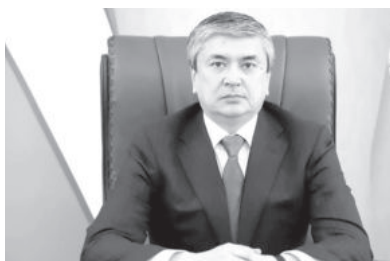
Бахром Норқобиллов. Председатель Государственного комитета ветеринарии и развития животноводства Республики Узбекистан.

Мясо-молочная продукция и яйца составляют 30 процентов наших потребительских расходов. Нетрудно заметить, что объем производства этой и другой продукции намного больше, поскольку данное направление занимает важное место в сельскохозяйственной сфере, способствует занятости населения. На фоне происходящих в мире событий и дефицита продуктов питания животноводство имеет особое значение в улучшении благосостояния граждан, обеспечении продовольственной безопасности.