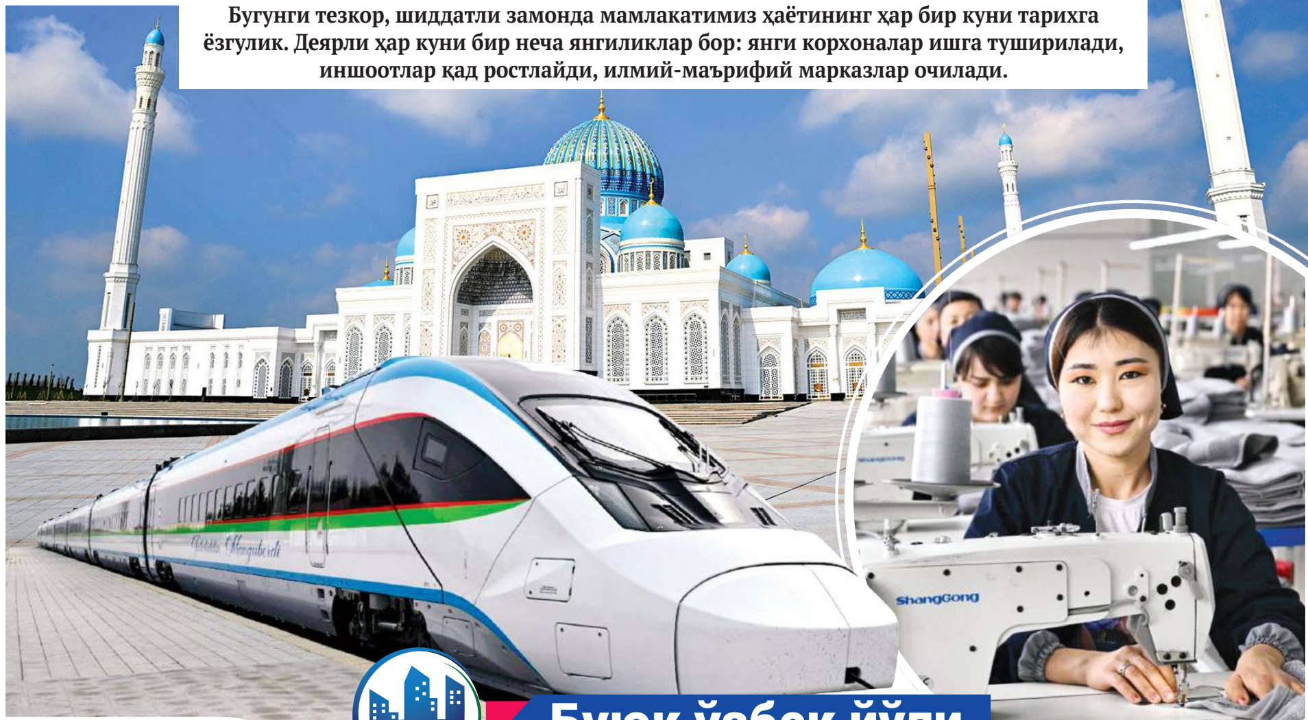
Янги Ўзбекистоннинг икки дурдонаси

Бугунги тезкор, шиддатли замонда мамлакатимиз ҳаётининг ҳар бир куни тарихга ёзгулик. Деярли ҳар куни бир неча янгиликлар бор: янги корхоналар ишга туширилади, иншоотлар қад ростлайди, илмий-маърифий марказлар очилади.