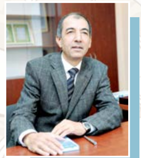
Sirojiddin SAYYID, O'zbekiston xalq shoiri

Ona yurtim, men bolangman, qosh-u ko'zim o'zingsan, Otajonim o'zingdiansan, onajonim o'zingsan.