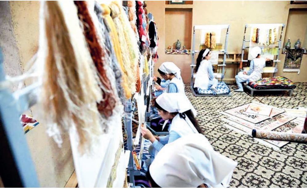
«Окончание. Начало на г-й стр.»

В поисках орнаментов братья Тоштемировы исколесили древние города Узбекистана. Беседовали с ткачами, набойщиками, абрандами, унаследовавшими от своих прадедов этот старый промысел.