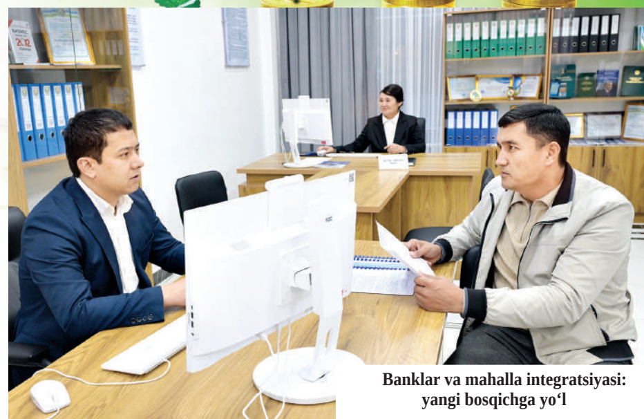
Banklar va mahalla integratsiyasi: yangi bosqichga yo‘l

Shu yil 16-dekabr kuni davlatimiz rahbari raisligida o‘tgan videoselektor yig‘ilishida aynan shu masalalar — banklarning aholi bandligini ta‘minlash, daromadli qilish, kambag‘allikni kamaytirishga qo‘shadigan hisssasi, oilaviy va kichik biznesni qo‘llab-quvvatlash, startaplarni, venchur kapital, infratuzilmaviy loyihalarni, yer resurslaridan samarali foydalanish, mikromoliya va faktoring sohalarni rivojlantirish bo‘yicha aniq yo‘nalishlar belgilab berildi. Mazkur yig‘ilish iqtisodiyotning asosiy qon tomiri