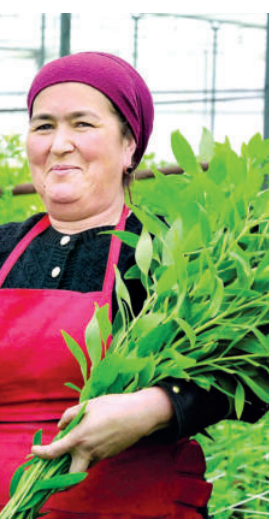
Yer charchab qolmaydimi?

5000 dan ziyodroq qopda parvarishlanayotgan qo'ziqorinlari kuniga ikki mahal osma quvurdan suv ichadi. Uch o'g'lining biri shu bilan band, tirikchiligi o'tib turibdi. Hosilning kilosi 25-30 mingdan sotiladi. Sotishda esa muammo yo'q. Do'konlar, supermarketlar bilan shartnoma tuzilgan, ko'tarasiya olib ketiladi. Yopiqlik binoda, ayniqsa, xonadonda yetishtirilgan qo'ziqorinning bozori chaqqon bo'lishi turgan gap. — Mehnatga layoqat, daromad olishga intilish insonning o'zida bo'lishi kerak ekan. Aks holda, ming harakat qilmang, bari befoyda. Yaqinda Prezidentimiz ham parkentlik tadbirkor ayol bilan suhbatida "Hamma sizga o'xshab mehnat qilsa, kambag'al ham, ishsiz ham bo'lmaydi", dedi-ku. To'g'ri-da, har bir oila o'zini o'zi band qilib, ro'zg'orini tebratib tursa, kambag'allik bo'lmaydi. Xudoga shukr, mahallamizdagi deyarli har bir uyda issiqxona qurilgan. Koreys karami ekib, 60-70, hatto 100 million so'mgacha daromad topayotgan oilalar bor, — dedi Muxtor aka. — Shunday bo'lsa-da, qo'ziqorinchilikka ham qiziqib, shu faoliyatni boshlayman deganlarga ish o'rgatib, ekib berishga ham vaqt topamiz.