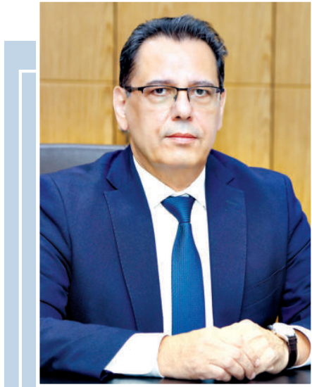
Qo'ng'iro'tboy SHARIPOV, oliy ta'lim, fan va innovatsiyalar vaziri