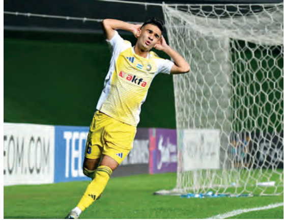
Начало матча было многообещающим. Пахтакоровцы, захватив инициативу, создали несколько

И четвертый тур Лиги чемпионов Азии для «Пахтакора» не задался. Проиграл столичный клуб «Ар-Райяну» из Катара - 0:1. Теперь занимает десятое место среди 12 команд.