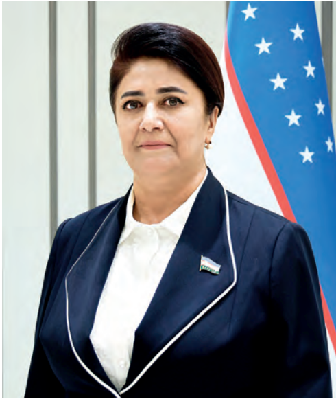
Жамила Бобаназарова. Сенатор, работающий на постоянной основе в Комитете Сената Олий Мажлиса Республики Узбекистан по вопросам международных отношений, внешнеэкономических связей, иностранных инвестиций и туризма.