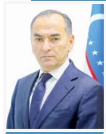
Хуррат ТЕШАБОВЕВ, инвестициялар, саноат ва савдо вазири ўринбосари

2025 йил якунлари ушбу йўналишдаги ислохотларнинг амалий натижаларини яққол намоён этди. Хусусан, республика экспорти 2025 йили олтинсиз ҳисобда 23,9 миллиард долларни ташкил этиб, 2024 йилдагига нисбатан 122 фоиз ўсди.