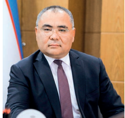
Иброхим Абдурахмонов. Министр высшего образования, науки и инноваций Республики Узбекистан академик.