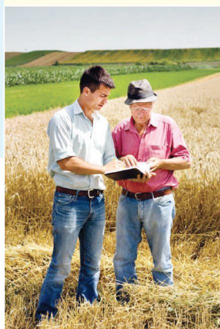
faoliyatini amalga oshirish uchun pay usuliga, jismoniy va (yoki) yuridik shaxslarning ixtiyoriy