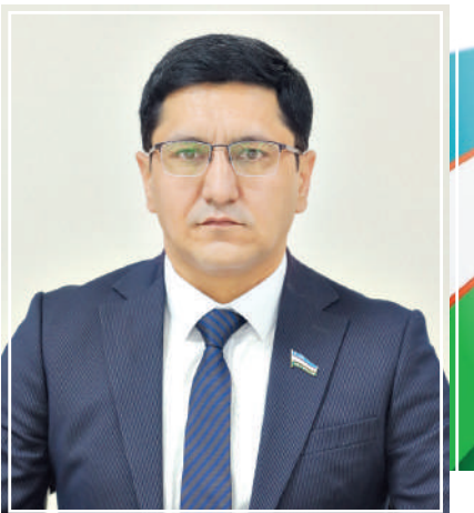
Жасур ЖУМАЕВ, Олий Мажлис Қонунчилик палатаси депутати:

— Янги шаклланган Қонунчилик палатаси таркиби жамиятимиздаги сиёсий жараёнлар янги босқичга ўтганини яққол