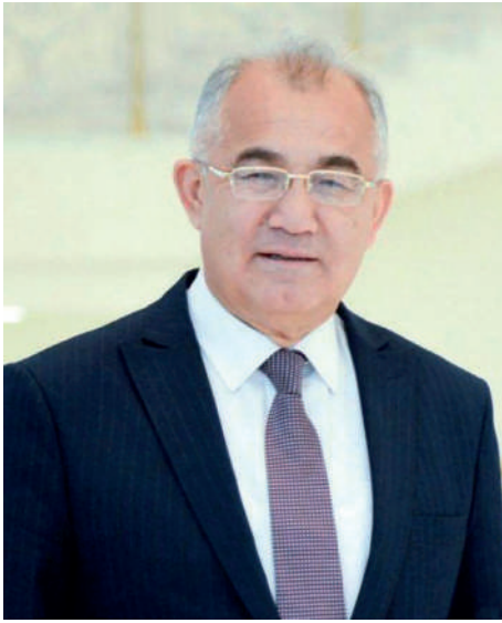
Акмал Саидов. Академик.

Мы живем в эпоху, когда темпы технологических изменений превосходят суммарную скорость всех предыдущих индустриальных революций. Сегодня мир переживает уникальный период - эпоху цифровой трансформации, что кардинально меняет наше общество.