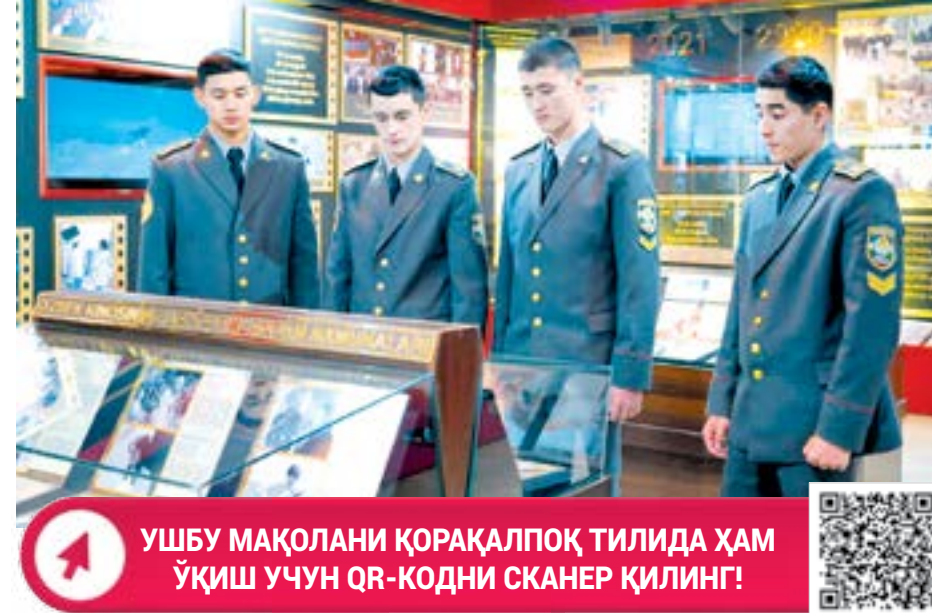
УШБУ МАҚОЛНИ ҚОРАҚАЛПОҚ ТИЛИДА ҲАМ ҲАМ АКС ЭТАДИ. Буларнинг замирида ёшларни ҳарбий соҳага қизиқтириш тургани мақсадга мувофиқ.

Яна бир қаҳрамон эса бош роль ижроси учун тақдирланганидан ҳам кўра тўрт ой давмида ватанпарварлик ҳиссида тар-