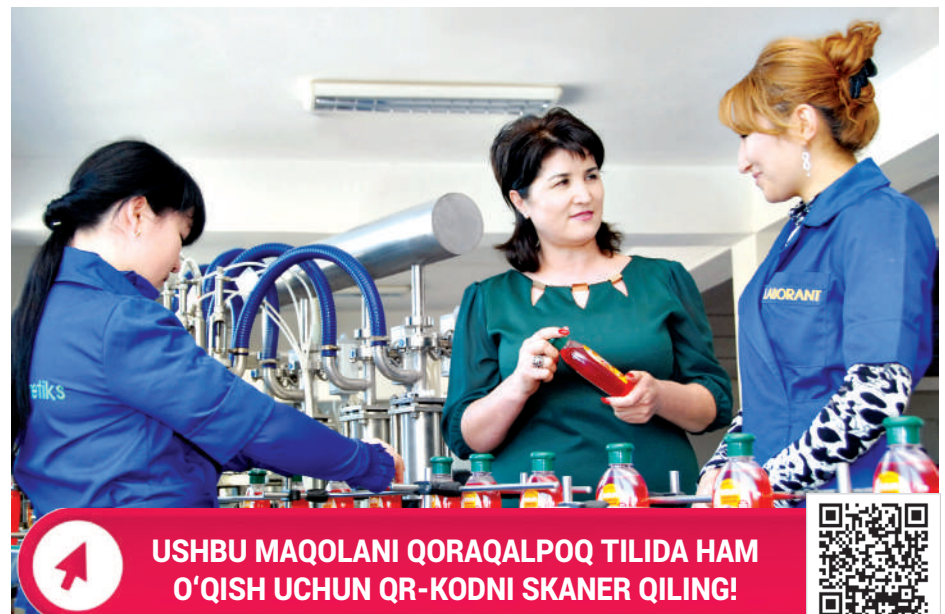
USHBU MAQOLANI QORAQALPOQ TILIDA HAM O'QISH UCHUN QR-KODNI SKANER QILING!