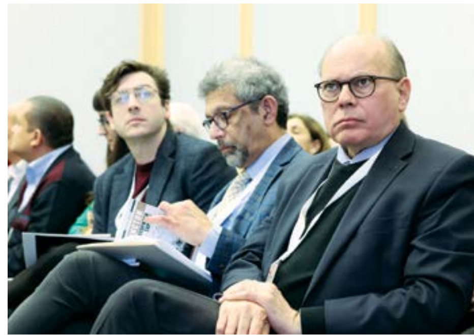
ga raqobat qilolmasligini bilib, isloh qildi...

Ijtimoiy hayotning barcha jabhalarini islohetishni maqsad qilgan jadidlar Vatani va millat taraqqiyoti yo'lidagi ushbu harakatlarning moliyaviy ta'minoti uchun xayriya jamiyatlari tuzgan. Bu jamiyatlar xalqdan yig'ilgan ionalar, millat boylari xayriyalari hisobidan faoliyat yuritgan. Toshkentda "Turon", Buxoroda "Tariyai atfol", Qo'qonda "G'ayrat" xayriya