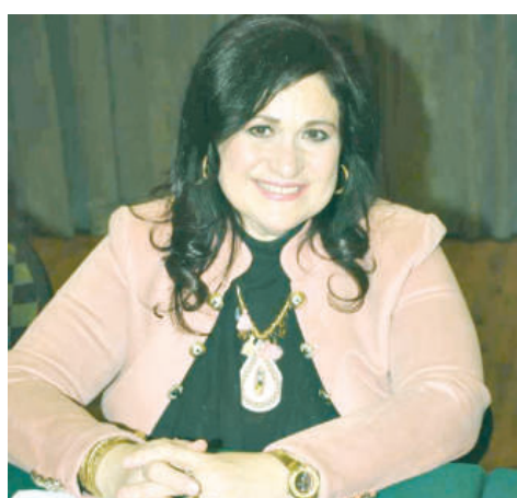
Дунё илм-фанига кўшилган беқиёс ҳисса