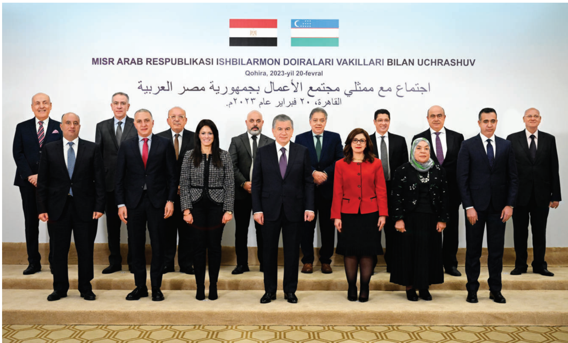
MISR ARAB RESPUBLIKASI ISHBILARMON DOIRALARI VAKILLARI BILAN UCHRASHUV

Ўзбекистон Республикаси Президенти Шавкат Мирзиёев Миср Араб Республикаси Президенти Абдулфаттоҳ ас-Сисининг таклифига биноан 20 февраль куни расмий ташриф билан Қоҳира шаҳрига келди.