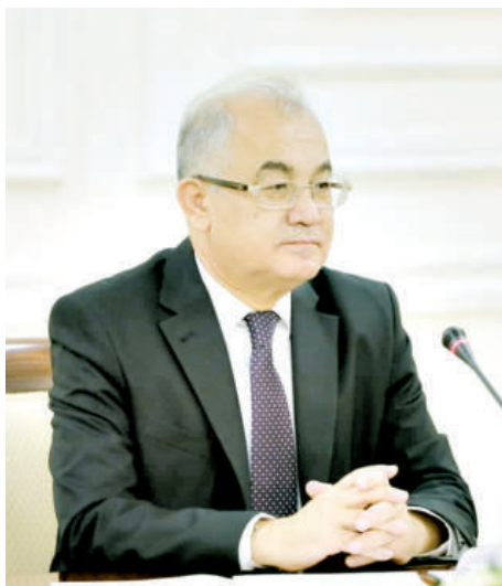
Акмал САИДОВ, Инсон ҳуқуқлари бўйича Ўзбекистон Республикаси Миллий маркази директори