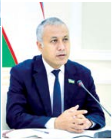
Xayrullo G'AFFOROV, Oliy Majlis Qonunchilik palatasi Spikeri o'rinbosari