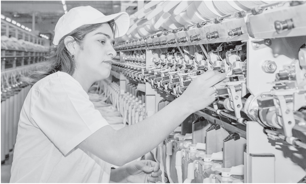
◀ (Окончание. Начало на 1-й стр.)

Хлопок - культура высокоприбыльная. Вместе с тем меняются подходы к этой отрасли. Недавно вместе со специалистами Министерства сельского хозяйства мы побывали в Сайхунбадском районе Сырдарьинской области, Дустликском и Пахтакорском - Джизакской.