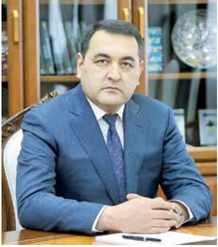
Hayrullo BOZOROV, Farqona viloyati hokimi