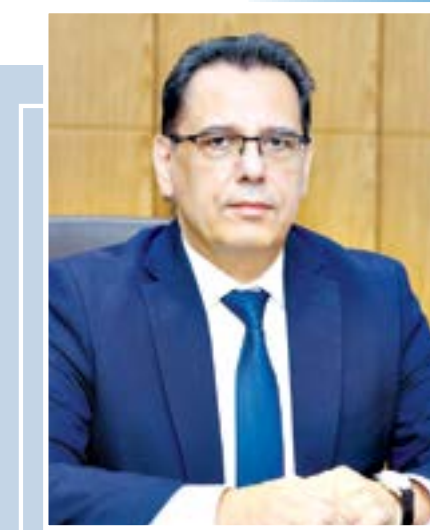
Qo'ng'iroq SHARIYOV, oliy ta'lim, fan va innovatsiyalar vaziri

1992-yili qabul qilingan Konstitutsiyada oliy ta'lim va huquqiy asoslariga alohida e'tibor berilgan bo'lsa-da, yangi tahrirdagi asosiy qonunda ta'lim muassasalarining akademik erkinligi, o'zini o'zi boshqarish va tadqiqotlar o'tkazish huquqlari mustahkamlangan. Bu yoshlarning bilim olish va ilmiy ishlarni olib