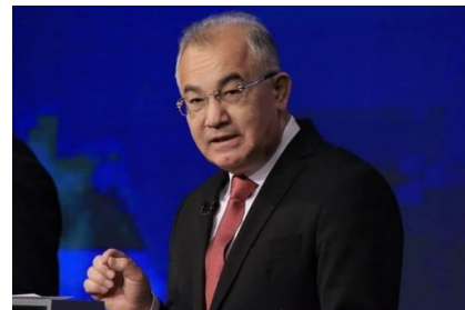
Акмал САИДОВ, академик

Халқимизнинг улугвор қудрати жўш урган ҳозирги замонда ўзбекистонда янги бир уйғониш — учинчи ренессанс даврига пойдевор яратилмоқда, десак, айти ҳақиқат бўлади. чунки бугунги Ўзбекистон — кечаги Ўзбекистон эмас. бугунги халқимиз ҳам кечаги халқ эмас.