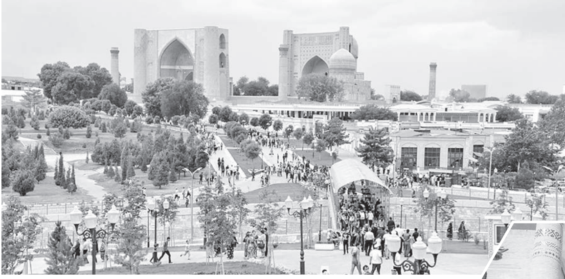
◀ (Окончание. Начало на г-й стр.)

Великий шелковый путь - исторический торговый маршрут, который соединил Восток и Запад на протяжении тысячелетий. Он получил свое название благодаря торговле шелком - одной из главных ее составляющих. На протяжении многих веков это имело огромное значение для развития экономики и культурного обмена между разными народами и государствами. Также Шелковый путь играл важную роль в формировании геополитической ситуации и дипломатических связей между различными цивилизациями.