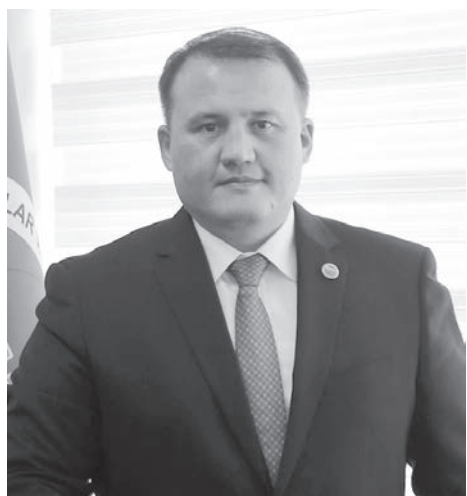
Ахтам Хайтов. Заместитель Спикера Законодательной палаты Олий Мажлиса Республики Узбекистан.