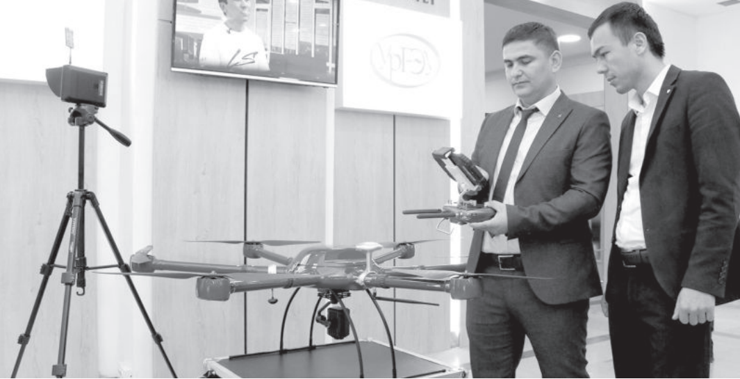
◀ (Окончание. Начало на 1-й стр.)

Понимая всю важность этого вопроса, Президент Шавкат Мирзиёев выдвинул ряд системных предложений и инициатив в области образования, духовно-нравственного воспитания, спорта. Важное направление - развитие человеческого капитала, который в нынешнее время растет более стремительными темпами, чем производственный. К примеру, во многих высокоразвитых странах суммарные расходы на сектор превышают производительные более чем в три раза. Претворение в жизнь намеченных планов в сфере поддержки идей и проектов молодежи позволяет обеспечивать занятость юношей и девушек.