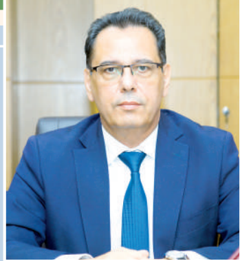
Qo'ng'irovboy SHARIPOV, oliy ta'lim, fan va innovatsiyalar vaziri

ISLOHOTLAR DOIRASIDA MAMLAKATIMIZ OLIY TA'LIM TIZIMINI XALQARO MAYDONGA OLIB CHIQISH, O'ZBEKISTONNI MINTAQADAGI NUFUZLI TA'LIM MARKAZIGA AYLTANTIRISH USTUVOR VAZIFALARDAN BIRI