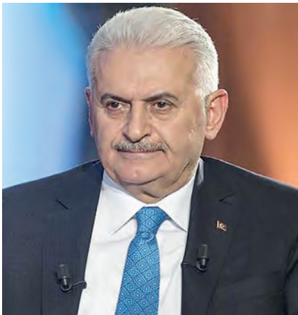
Бинали Йылдырым. Председатель Совета старейшин Организации тюркских государств (ОТГ).