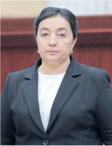
Зулайхо Маккамова. Заместитель Премьер-министра Республики Узбекистан председатель Комитета семьи и женщин РУз.