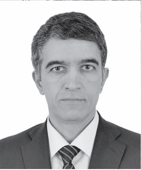
Шавкат Хамраев. Министр водного хозяйства Республики Узбекистан.

При этом и водные пути, и водные ресурсы республик региона тесно взаимосвязаны. Поэтому невозможно обойтись без «водной дипломатии» с соседними странами. Следует признать, что за последние десятилетия в сфере накопилось немало проблем, к решению которых государства региона активно подключились после 2017 года.