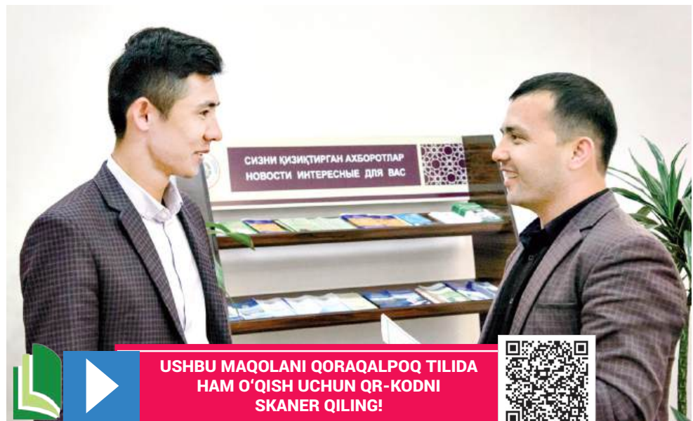
USHBU MAQOLANI QORAQALPOQ TILIDA HAM O'QISH UCHUN QR-KODNI SKANER QILING!

Yangi bosqichda ayollar va bolalarni himoya qilish tizimi nafaqat qonunchilikni mustahkamlashga, balki ijtimoiy, psixologik va moliyaviy qo'llab-quvvatlashni yanada takomillashtirishga qaratilgan. Bu, o'z navbatida, jamiyatda gender tenglikni ta'minlash, oilaviy zo'ravonlik va kamsitish holatlarini kamaytirishga xizmat qilishi shubhasiz. Shuningdek, ushbu yangi tizim profilaktik yondashuv, zamonaviy monitoring va samarali yordam mexanizmlari orqali xalqaro standartlarga moslashish, shuning vositasida "inson qadri uchun" degan yuksak bashariy g'oya yo'lidagi yana bir muhim qadam bo'ldi.