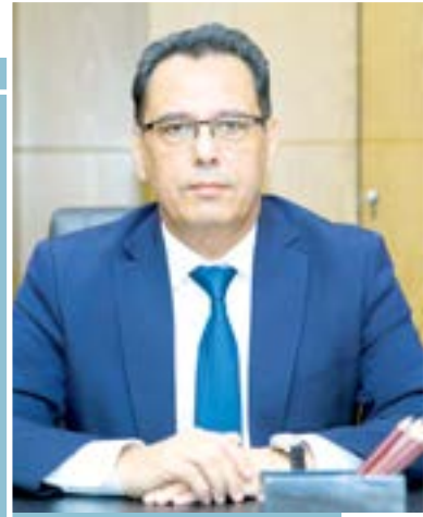
Qo'ng'iroq SHARIPOV, oliy ta'lim, fan va innovatsiyalar vaziri

Oliy ma'lumot har bir insonga jamiyatda o'z o'rni va mavqeiga ega bo'lish imkonini bersa, davlatga bilimlarni tanlab olish, qo'llab-quvvatlash hamda ijtimoiy, iqtisodiy, muhandislik va texnologik sohalarini ilmiy-institutsional qamrab olishga, pirovardida, inson kapitalini samarali yo'naltirishga xizmat qiladi.