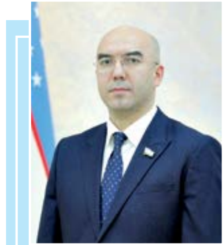
Baxtiyor PO'LATOV, Oliy Majlis Qonunchilik palatasi deputati