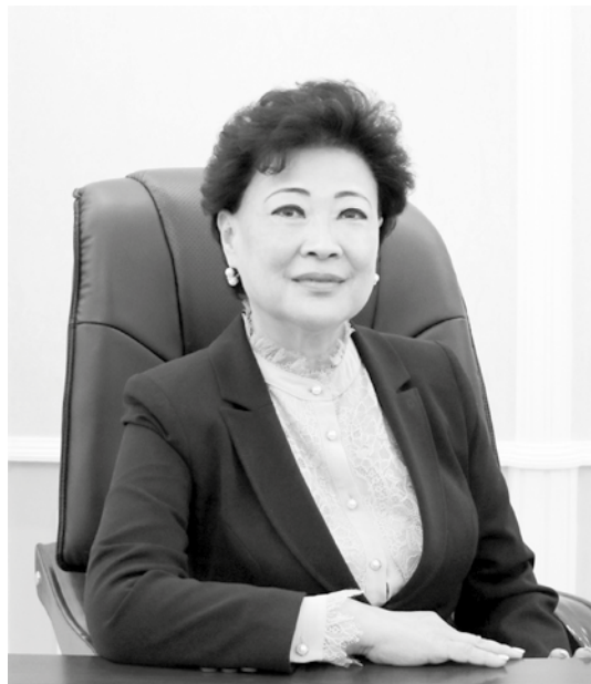
Агрипина Шин. Министр дошкольного образования Республики Узбекистан.