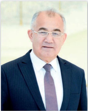
Акмал Саидов. Первый заместитель Спикера Законодательной палаты Олий Мажлиса Республики Узбекистан.

Завершается четвертый год интенсивной и последовательной реализации разработанной по инициативе Президента и утвержденной 7 февраля 2017 года Стратегии действий по пяти приоритетным направлениям развития Республики Узбекистан в 2017-2021 годах.