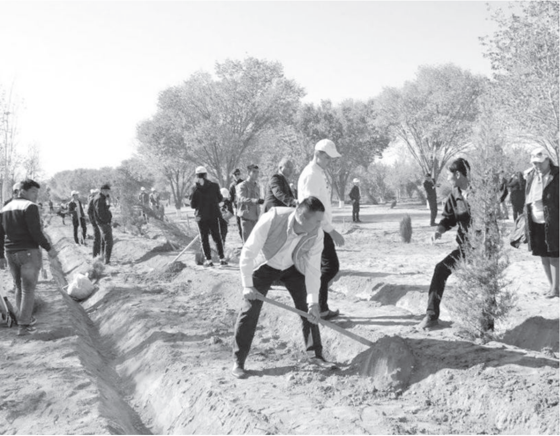
◀ (Окончание. Начало на 1-й стр.)

В целях определения приоритетных направлений государственной политики в области охраны окружающей среды, предупреждения нарушений законодательства в сфере охраны природы, внедрения эффективных механизмов их выявления и предупреждения, усиления персональной ответственности руководителей государственных органов и хозяйствующих субъектов, граждан за санитарное и экологическое состояние населенных пунктов утверждена Концепция охраны окружающей среды Республики Узбекистан до 2030 года. В рамках нее системно реализуются соответствующие «дорожные карты» и государственные программы.