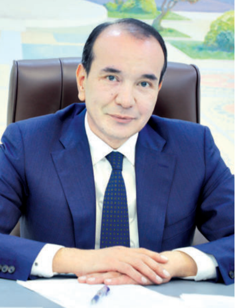
Озодбек Назарбеков. Министр культуры Республики Узбекистан.