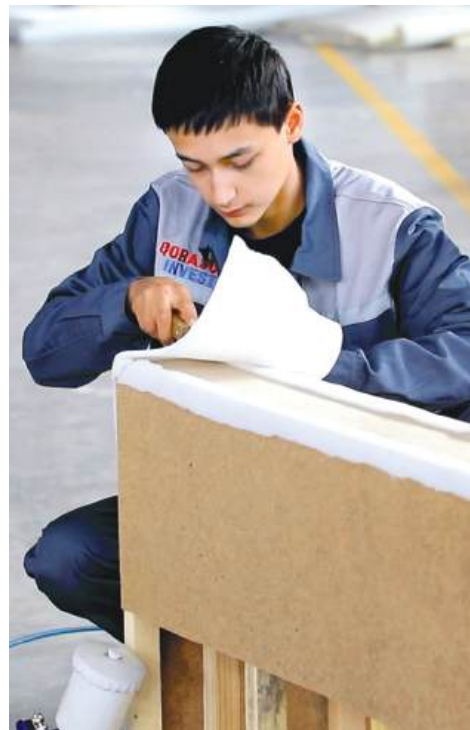
o'quv yuklamasining 40 foizi nazariy, 60 foizi esa amaliy mashg'ulotlarga ajratilgan. Bu esa talabalarga bevosita ishlab chiqarish muhitida

Shuningdek, korxonada mutaxassislarining ta'lim jarayoniga faol jalb etilishi hamda o'quv dasturlarining ishlab chiqarish ehtiyojlariga muvofiq mutazam takomillashtirilishi ta'lim sifatini oshirishda muhim omil bo'lmoqda. Natijada bitiruvchilarning mehnat bozoridagi raqobatbardoshligi sezilarli darajada oshishiga erishildi. Ayniqsa, dual ta'lim tizimi zamonaviy sanoat taraqqiyoti talablariga to'liq javob beradigan, amaliy ko'nikmalarga ega va raqobatbardosh muhandis kadrlar tayyorlashda qo'l kelayotir. Mazkur tizimni yanada rivojlantirish, ta'lim va ishlab chiqarish o'rtasidagi integratsiyani chuqurlashtirish esa, shubhasiz, mamlakatimiz industrial salohiyatini mustahkamlashga xizmat qiladi.