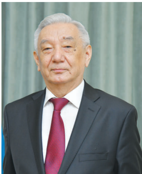
Мирзо Улуғбек АБДУСАЛОМОВ, Ўзбекистон Республикаси Конституциявий суди раиси, Ўзбекистонда хизмат кўрсатган юрист