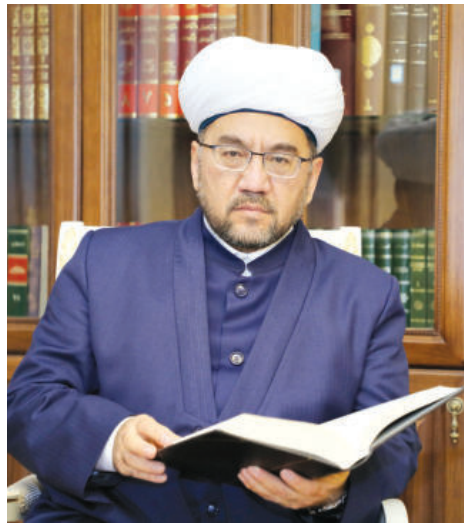
Нуриддин ХОЛИҚНАЗАРОВ, Ўзбекистон мусулмонлари идораси раиси, муфтий