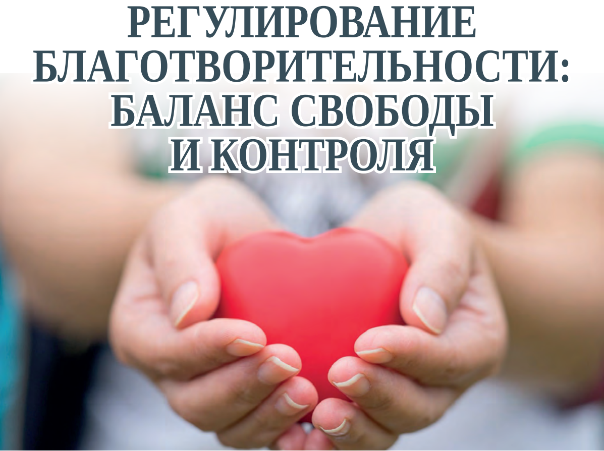
← (Окончание. Начало на 1-й стр.)

Основные механизмы регулирования включают законодательное закрепление статуса благотворительных организаций, налоговые льготы для жертвователей и самих фондов, государственный контроль за расходованием средств, грантовую поддержку социально значимых проектов и создание информационных платформ, повышающих прозрачность сектора.