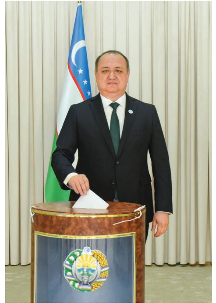
Кандидат в Президенты Республики Узбекистан от Народно-демократической партии Узбекистана Улугбек Иноятов проголосовал на избирательном участке № 427 Шайхантахурского района столицы.

Выборы Президента всегда являлись важным институтом в развитии демократических государств и системы политических прав граждан. Ведь основу каждого демократического общества составляют свободные и справедливые выборы.