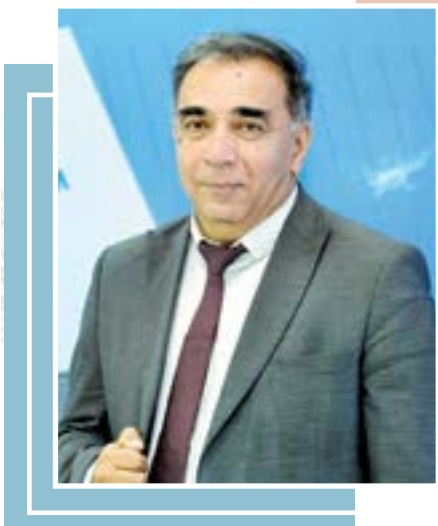
Омонулла МУҲАММАДЖОНОВ, юридик фанлар доктори, профессор

Мамлакатимизда ҳар йилги давлат дастурларини 5-10 йиллик даврга мўлжалланган стратегик режалаштириш асосида қабул қилиш амалиёти шаклланди. Хусусан, жорий йил 21 февралда “Ўзбекистон — 2030” стратегиясини “Ёшлар ва бизнесни қўллаб-қувватлаш йили” да амалга оширишга оид давлат дастури тасдиқланди.