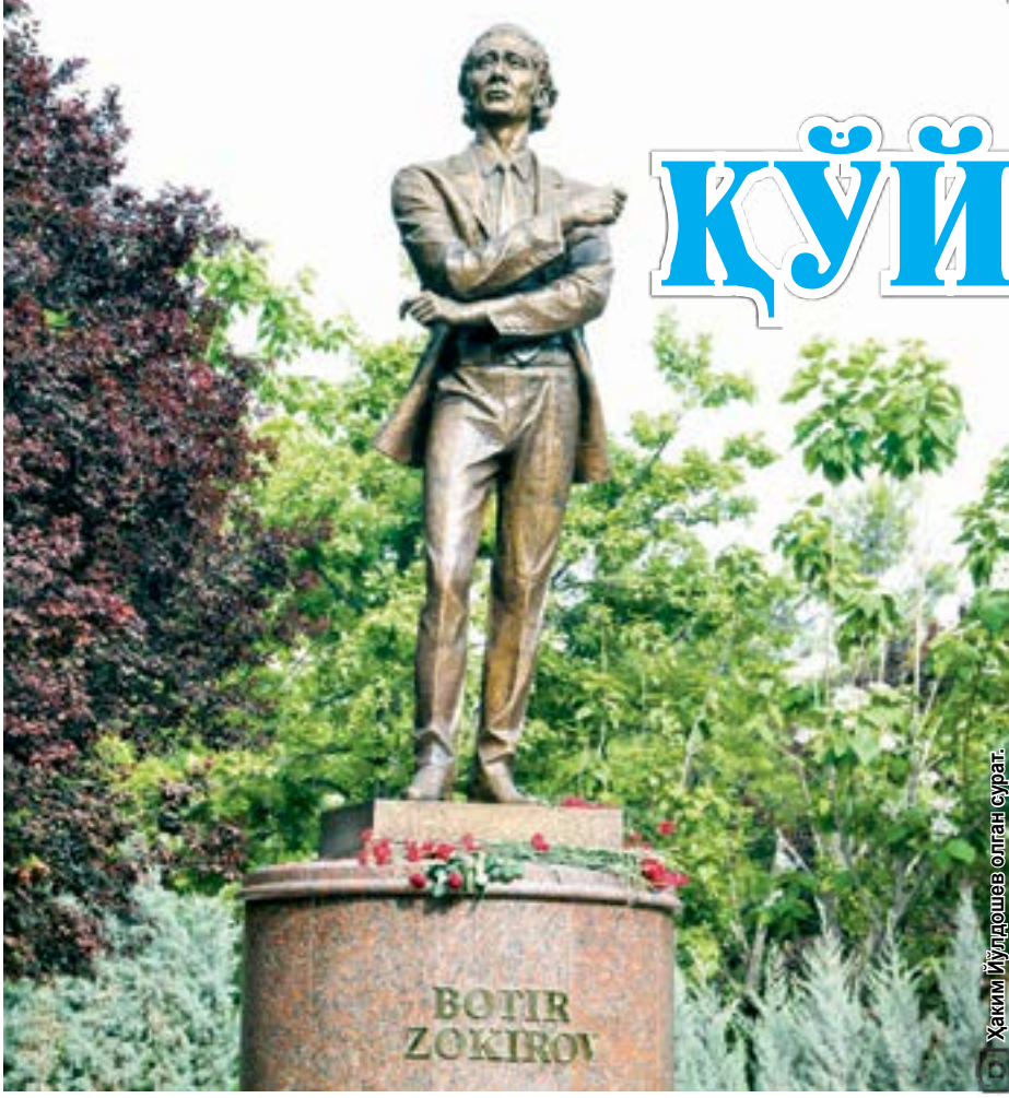
Хайкал Муҳаммад Юсуф Раҳимов ташкил қилган

улуг аждодларимиз бор. Ҳавас қилса арзийдиган беқиёс бойликларимиз бор. Ва мен нишонман, насиб этса, ҳавас қилса арзийдиган буюк келажагимиз, буюк адабиётимиз ва санъатимиз ҳам албатта бўлади”, дея билдирган эзу ниятлари ўтган вақт мобайнида босқичма-босқич юзага чиқмоқда. Кейинчалик маданият ва санъат соҳаси вакиллари билан яна бир неча бор учрашувлар ўтказилганини ҳам айтиб ўтиш ўринлидир.