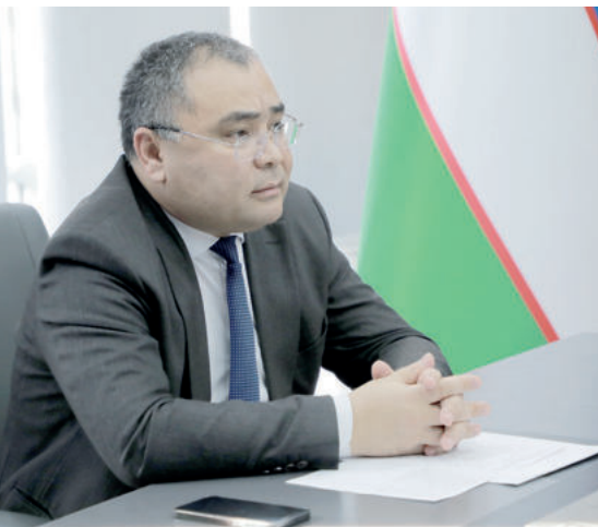
Иброхим Абдурахмонов. Министр инновационного развития Республики Узбекистан.