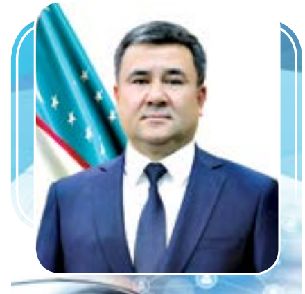
Юсуфжон УСМОНОВ, маданият вазири ўринбосари

Мамлакатимиз тараққийнинг янги бошқичида маданият ва санъат соҳасига алоҳида эътибор қаратиляпти. Кейинги 10 йилда маданият ва санъат соҳасига оид 4 қонун, давлатимиз раҳбарининг 35 қарор ва фармони, Вазирилар Маҳкамасининг 100 га яқин меъёрий ҳужжатлар қабул қилинди. Давлат сиёсати даражасида эътибор қаратилаётгани учун ҳам Ўзбекистон маданияти янгиланмоқда, ривожланиш бошқичига кирмоқда. Ҳар йили 15 апрелнинг Маданият ва санъат ходимлари кунини сифатида нишонланаётгани бу борада муҳим аҳамият касб этапти.